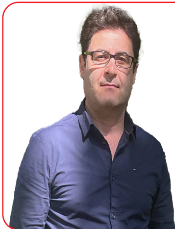
په رویز ره حیمزاده

به رینی جه ماوه ری چینی ناوه راستی کومه لگا بۆ نازادی له ئارادا بوو، ره وتی ریفورم مه جالیکی هه ناسه کیشانی دا بۆ ئه وه ی نه کا ئه م توو په ییه په نگوار دووه بته قیته وه و شۆرشیکی لی بکه ویتته وه، که له و پیلانه شدا سه رکه وت