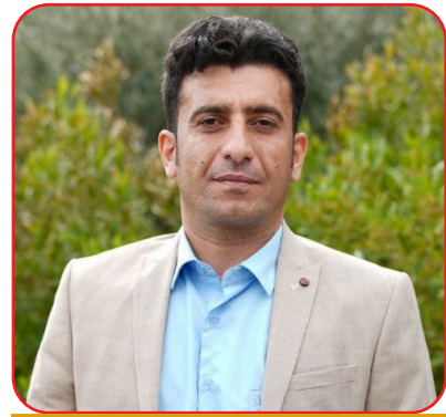
كه یوان دوورودی

به رامبه ر به ئیران، سپانیا جارێ تر بالۆیخانه ی خۆی له تاران كرده وه و ئالمان دوا ی ماوه یه کی دوورودرۆژ په یوه نییه كانی خۆی له گه ل تاران جاریکى تر ده ست پێ كرده وه له كانێكدا كه گشت لایه چاوه پوانی ته ریه كه وته یی پۆیم بوون . بابه ته كه تا شوپێن چوه پێش كه ئوتیش و ئیٹالیاش پێگه یان به ئامریكا نه دا تا له پێگه نیزامییه كانیان كه لك له دژی ئیران وه ریه گه ی و نۆنالد ترامپ، سه رۆك كۆماری ئامریكا هه په شه ی كرد كه به زوو یی پێداچوونه وه به بناغه كانی به شداری و ئه ندامه تی له «نا تۆ» ده كات؛ چونكه ولاتانی ئوروپایی ئاماده نین له «پۆژه سه خته كاندا» (ئاماژه بۆ سه ری ئیران، به تاییه تی كرده وه ی كه رووی هورمۆز) یاره مه تیده ری ئامریكا بن . هه ر له م ماوه دا كۆماری ئیسلامی بۆی ده ره كوت كه به داخستنی گه رووی هورمۆز، ده وتوانی كارتی «تیرلیدی می ئابووری» بۆ تۆقاندن و پاشه كشه پێكردنی كۆمه لگه ی نیوده وه لته ی به كار بێن . كاتێ پۆیم ده ستی بۆ ئه م كاره ت برد، حووسیهه كان بیریان له وه كرده وه كه ئه وانییه ته وتوانن له پێگه ی دروستکردنی هه په شه بۆ سه ر گه رووی «بابه ئه له نه دب» باجوهرگرتن له جیهان بکه ن به پرده بازێ بۆ گه یشتن به ئامانج و به بارمه گرتنی ئابووری جیهان . له بیرمان نه چێن كه به پێی راپۆرته كان، چین و پووسیه به شدارییه کی چالاكانه یان له شه پی كۆماری ئیسلامی دژ به ئامریكا و ئیسرائیل كرده وه . كۆی ئه م خالانه ی سه ره وه ده ره خه ری ئه و راستیه یه كه كۆماری ئیسلامی وهك زۆدییه ی دیارده كانی تری ئه م سه رده مه، بابه تیکى ئالۆز و لیکته نراوی نیوده وه تیهه و خویندنه وه یه کی دروست بۆ چیه تی و چۆنیه تی ئه م پۆیم، ده یب هه لگری هه موو ئه م په ندانه بێن . پۆیمی ئیران له