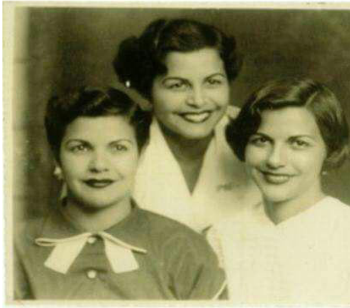
بووه هۆکاریک بۆ ئەوێ خەلک باسیکی گشتی لە هەر کردەوێهیک رق و بێزاری خۆیان لەو حکومەتە کە توندووتیژی بە دواوه بێ بە