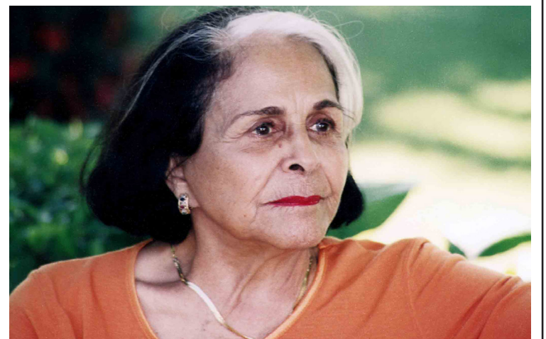
رێزگرتنیکی لە یادی خوشکانی لە نیو دەچن بەلام هەر ئەو کارە